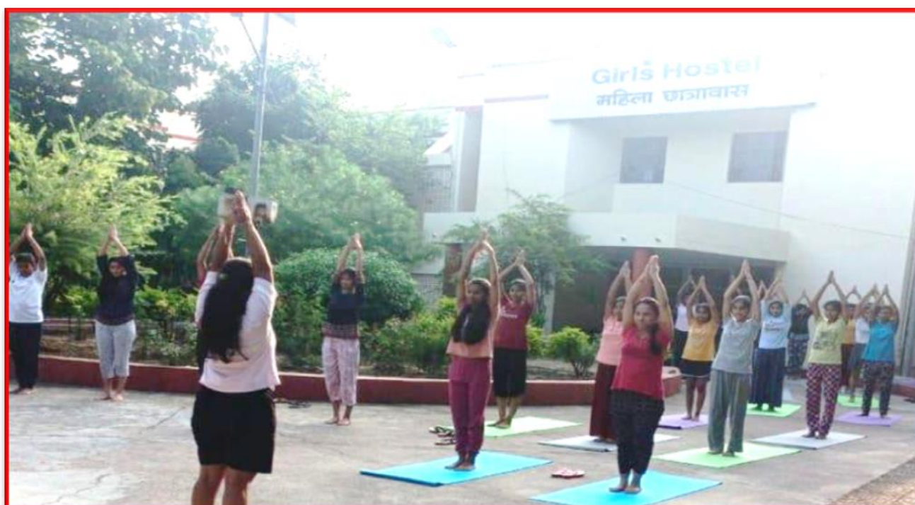
Figure 28 Yoga Awareness