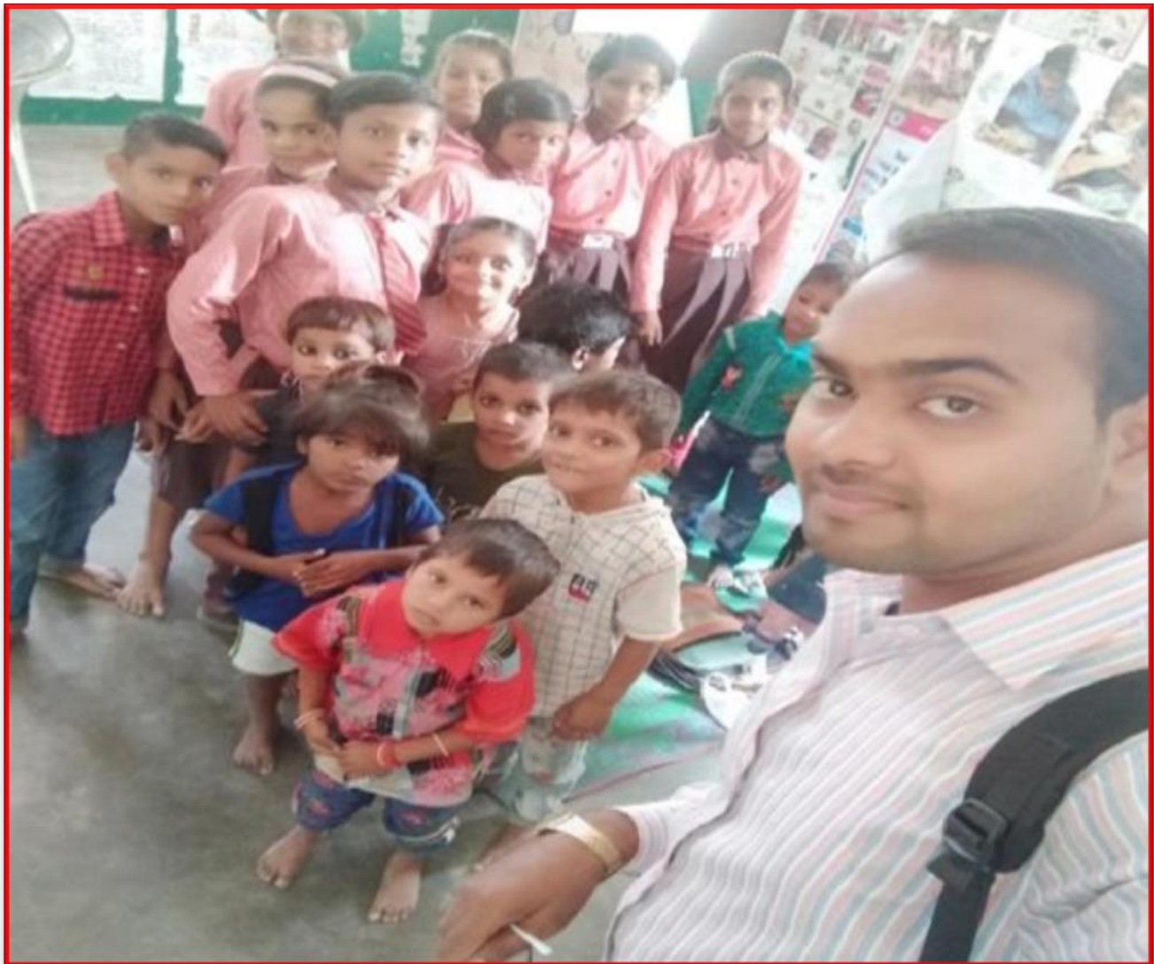
Figure 19 Field Survey on Nutrition with UNICEF

Details of the Program: छत्रपति शाहू जी महाराज विश्वविद्यालय के समाज कार्य विभाग के बच्चों के द्वारा विभिन्न गांवों में Unicef के साथ Child Nutrition & Health पर Field survey किया गया।