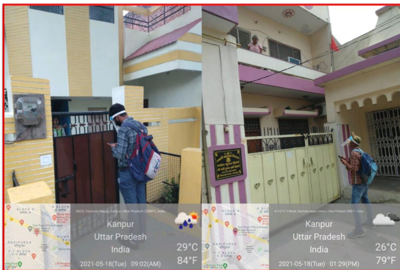
Figure 20 Geo Tagging and Public Awareness on SWM

Details of the Program: Department of Social Work, Kanpur Municipal Organization and Dikshank Organization aware the community for giving the solid waste only to the municipal waste collector and don't throw the waste on streets or any empty place. And we also tagged houses through geo tagging so, Kanpur Municipal Corporation could easily identify the houses.