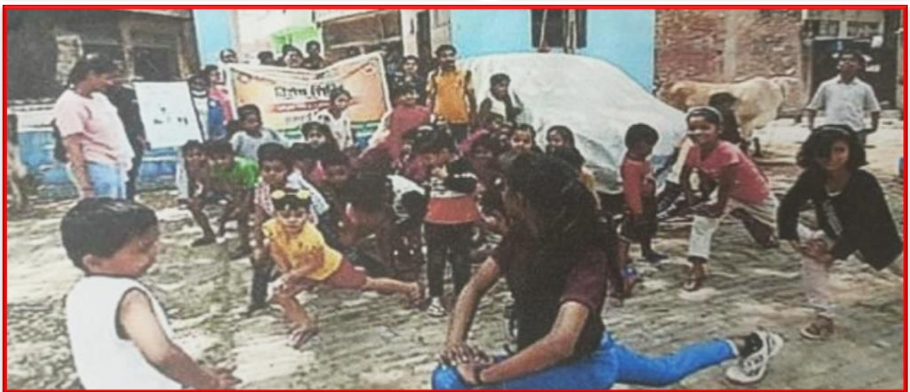
Figure 16 Mental Health