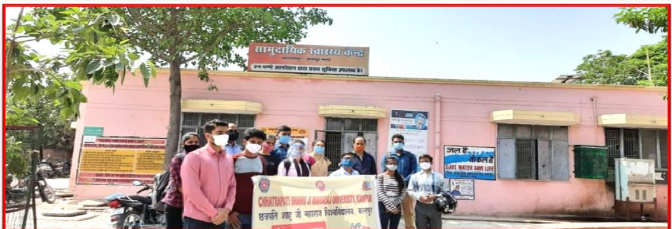
Figure 3 Awareness Campaign for Vaccination against Covid -19