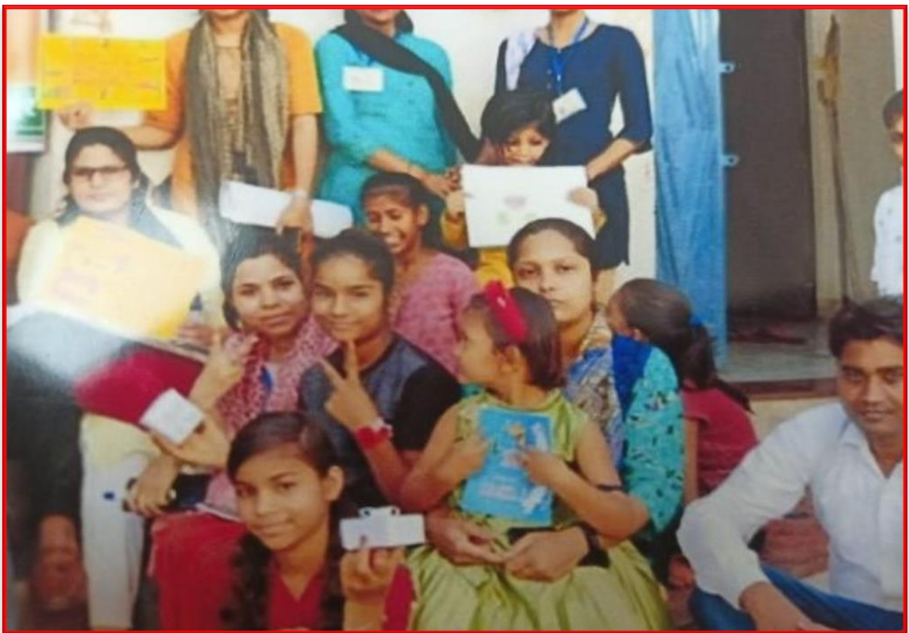
Figure 9 Making Craft from Waste Materials

Details of the Program: शिक्षा विभाग के विद्यार्थियों एवं एन०एस०एस० स्वयंसेवक, छत्रपति शाहू जी महाराज विश्वविद्यालय, कानपुर द्वारा दिनांक 28 मार्च 2022 को “अनुपयोगी वस्तुओं से क्राफ्ट बनाना” बरसाईतपुर के प्राथमिक विद्यालय व बस्ती के लोगों एवं विद्यार्थियों को सिखाया गया। जिसमें बच्चों से पेपर के बैग बनाना, क्राफ्ट बनाना आदि सिखाया गया।