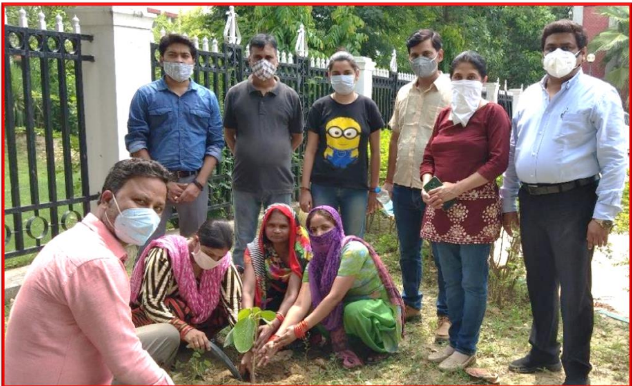
Figure 26 World Environment Day

Details of the Program: दिनांक 05 जून 2021 को विश्व पर्यावरण दिवस के अवसर पर समाज कार्य विभाग ने अपने प्रांगण में विश्वविद्यालय परिसर में कार्यरत महिला सफाई कर्मचारियों के साथ बरगद के पौधे को रोपा और साथ ही साथ इन महिला सफाई कर्मचारियों ने शपथ ली की वे सभी मिलकर इस पौधे की रक्षा का संकल्प लिया, जिससे कि वातावरण को हरा-भरा और शुद्ध बनाया जा सके।