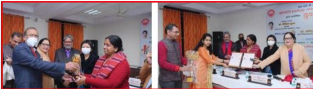
Figure 24 YUVA SAMAGAM