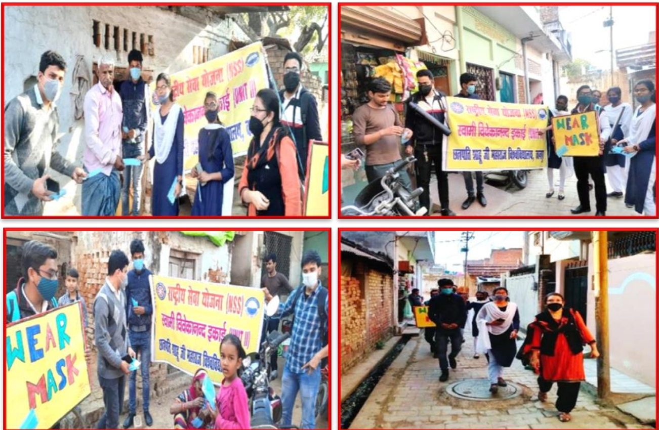
Figure 2 Awareness to Wear Mask

Details of the Program: शिक्षा विभाग के विद्यार्थियों एवं एन०एस०एस० स्वयंसेवक, छत्रपति शाहू जी महाराज विश्वविद्यालय, कानपुर द्वारा दिनांक 22 फरवरी 2021 को “कोविड-19 के प्रति जागरूकता” हेतु निकट स्थित बस्ती में लोगों को मास्क पहनने के लिए पोस्टर एवं स्लोगन के माध्यम से प्रोत्साहित किया तथा निःशुल्क मास्क का वितरण भी किया।