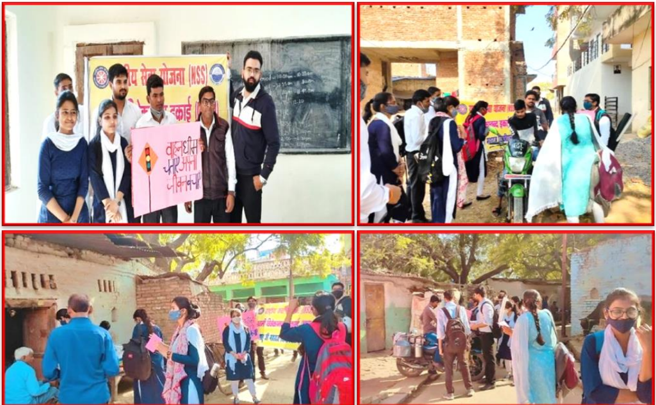
Figure 1 Traffic Rules Awareness Campaign

Details of the Program: शिक्षा विभाग के विद्यार्थियों एवं एन०एस०एस० स्वयंसेवक, छत्रपति शाहू जी महाराज विश्वविद्यालय, कानपुर द्वारा दिनांक 20 फरवरी 2021 को "यातायात के नियमों के प्रति जागरूकता" हेतु निकट स्थित बस्ती में पोस्टर, स्लोगन एवं रैली निकाली। नियमों का पालन न करने वाले लोगों को सचेत किया।