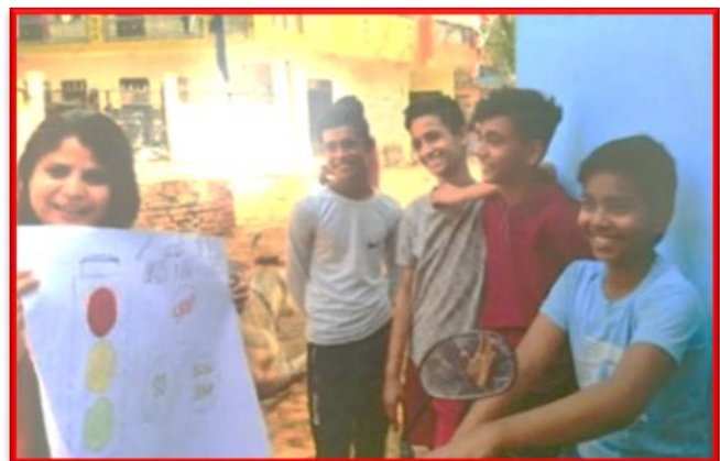
Figure 7 Awareness about Traffic Rules