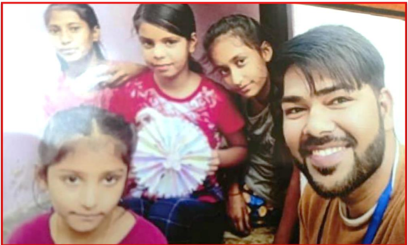
Figure 10 Making Craft from Waste Materials