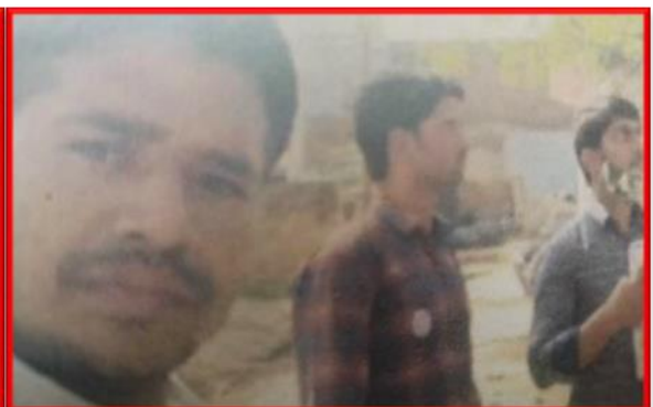
Figure 4 Covid-19 Vaccination Awareness