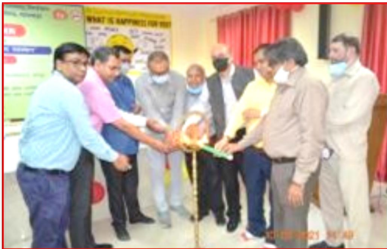
Figure 25 No Smoking Day

Details of the Program: On the occasion of No Smoking Day a seminar was organized under the joint aegis of university institute of health sciences and district tobacco control cell at happiness centre of health sciences. Resource person Dr Ravi Kumar quoted the data that approx. 50% of population who Use tobacco products according to world health organization 50 percent of people who do so die.