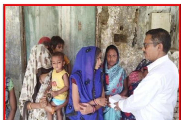
Figure 17 Distribution of Nutrition food in near by Basti