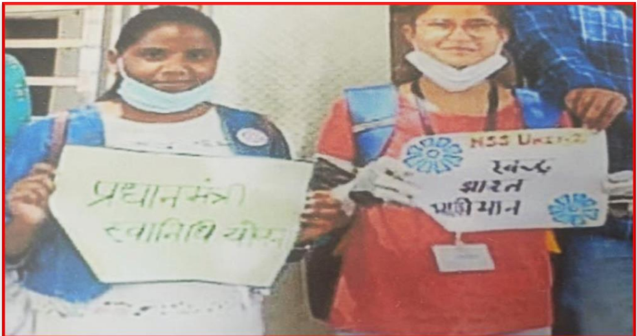
Figure 14 Health and Hygiene