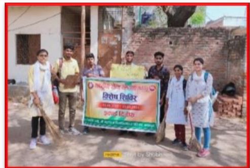
Figure 11 Cleanness Campaign