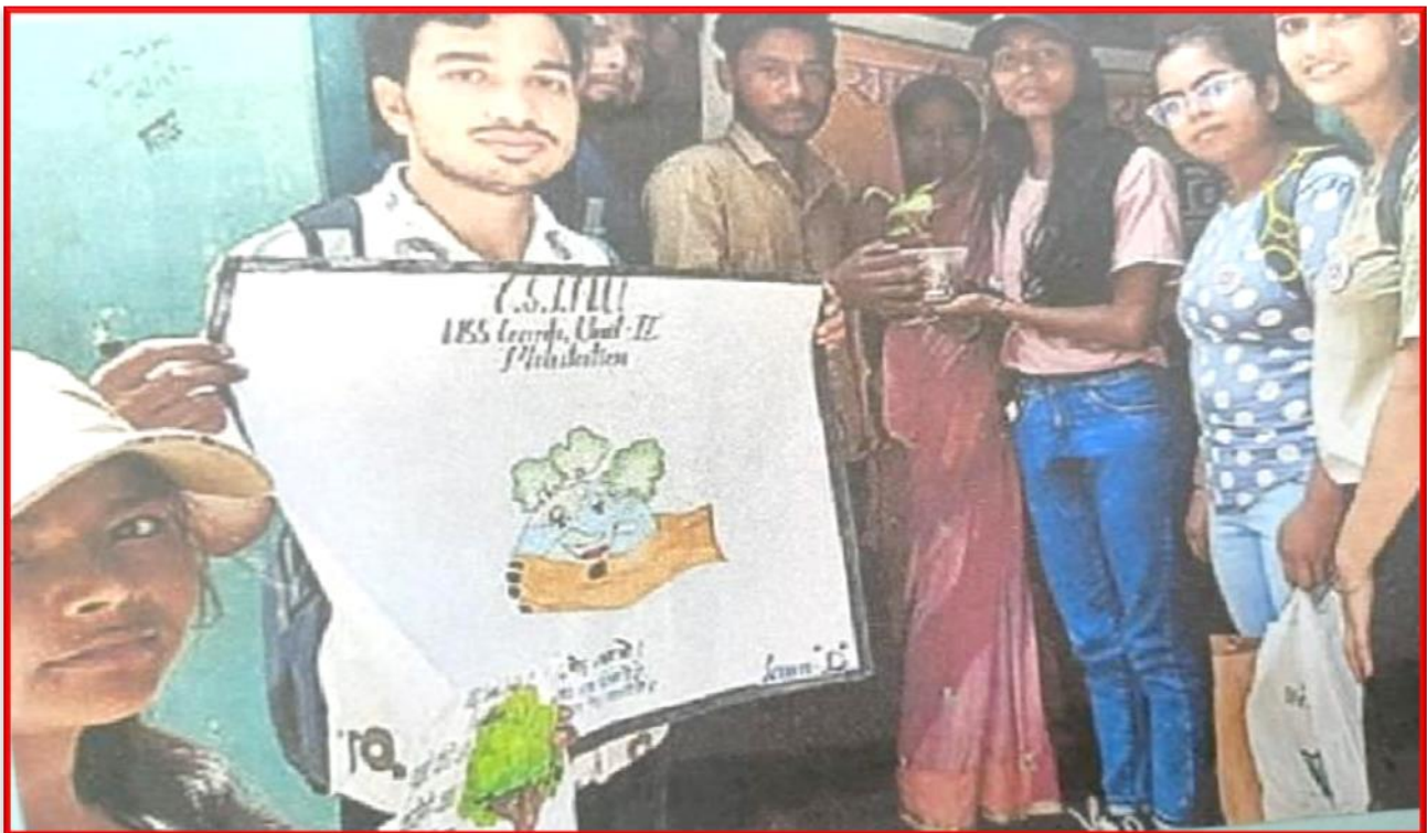
Figure 8 Plantation

Details of the Program: शिक्षा विभाग के विद्यार्थियों एवं एन०एस०एस० स्वयंसेवक, छत्रपति शाहू जी महाराज विश्वविद्यालय, कानपुर द्वारा दिनांक 28 मार्च 2022 को "वृक्षारोपण" के महत्व एवं उससे सम्बन्धित लाभों के बारे में जागरूक किया गया। इस आयोजन के तहत छात्र-छात्राओं को ग्लोबल वार्मिंग, ग्लेशियर्स का पिघलना और पेड़ों के न होने से नुकसानों के बारे में अवगत कराया गया तथा वृक्षों की उपयोगिता के विषय में निबंध प्रतियोगिता एवं विचार प्रस्तुति प्रतियोगिता आयोजित की गयी।