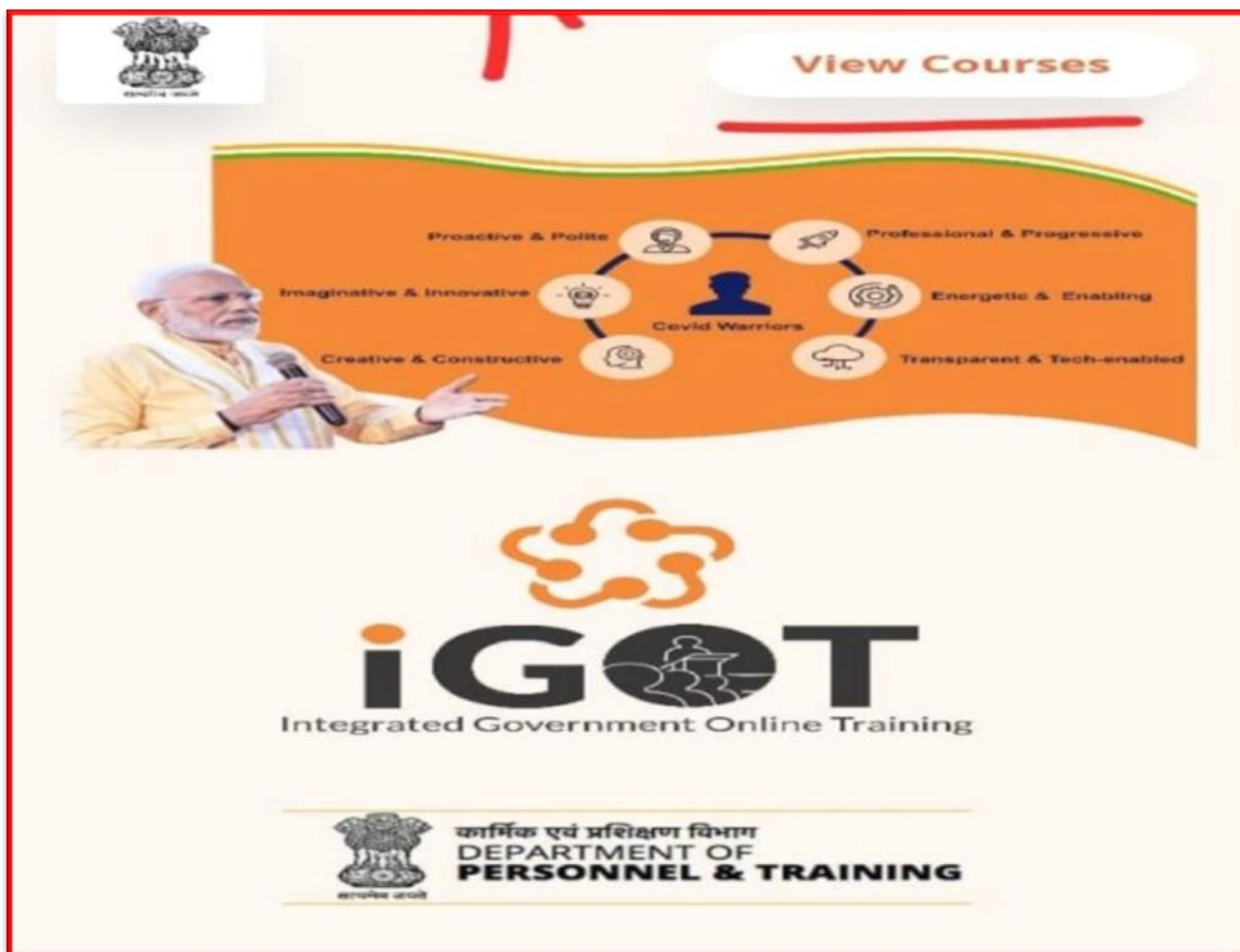
Figure 37 I-GOT online Training Programme

Details of the Program: Under the Program a training module was launched for management of COVID -19 named : Integrated Government Online Training 9I-GOTO portal on Diksha platform of MHRD. A lot of people participated in the Program and learnt to cope with Covid .