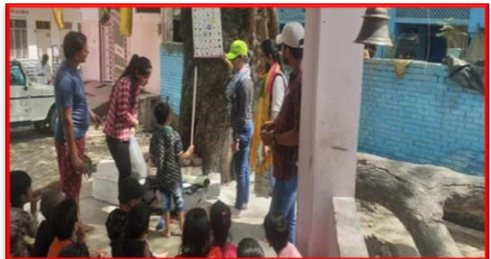
Figure 18 Teaching Drop-outs of Basti