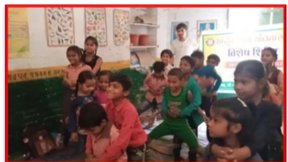
Figure 5 Self Defense