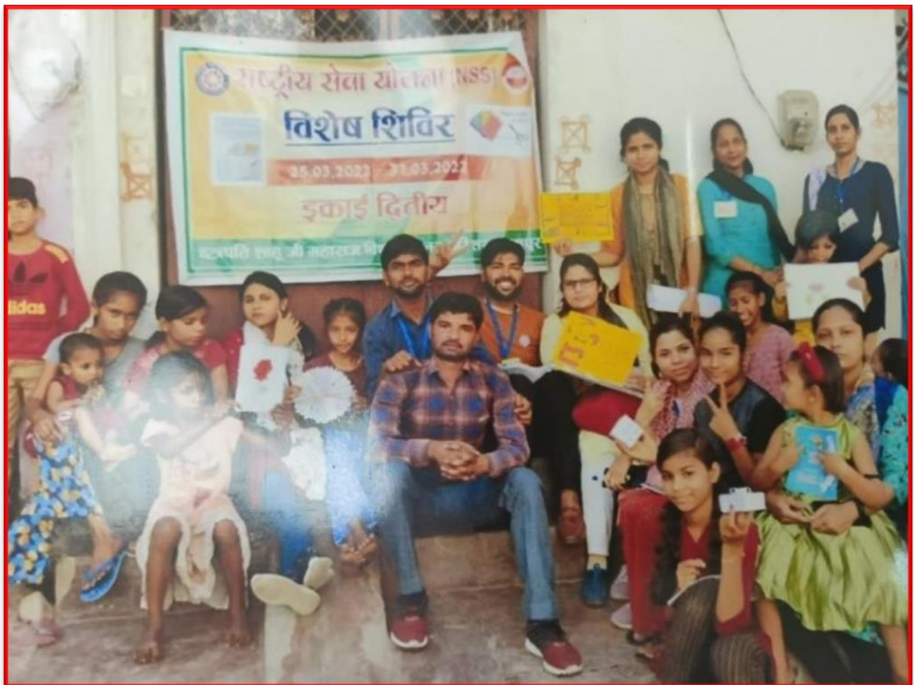
Figure 6 Awareness of Education

Details of the Program: शिक्षा विभाग के विद्यार्थियों एवं एन०एस०एस० स्वयंसेवक, छत्रपति शाहू जी महाराज विश्वविद्यालय, कानपुर द्वारा दिनांक 26 मार्च 2022 को “शिक्षा के प्रति जागरूकता” के विषय में बरसाइतपुर के बस्तीवासीयों शिक्षा के महत्व, बच्चों को प्रतिदिन विद्यालय भेजने एवं शिक्षा के अधिकार और उससे होने वाले लाभ के प्रतिजागरूक किया।