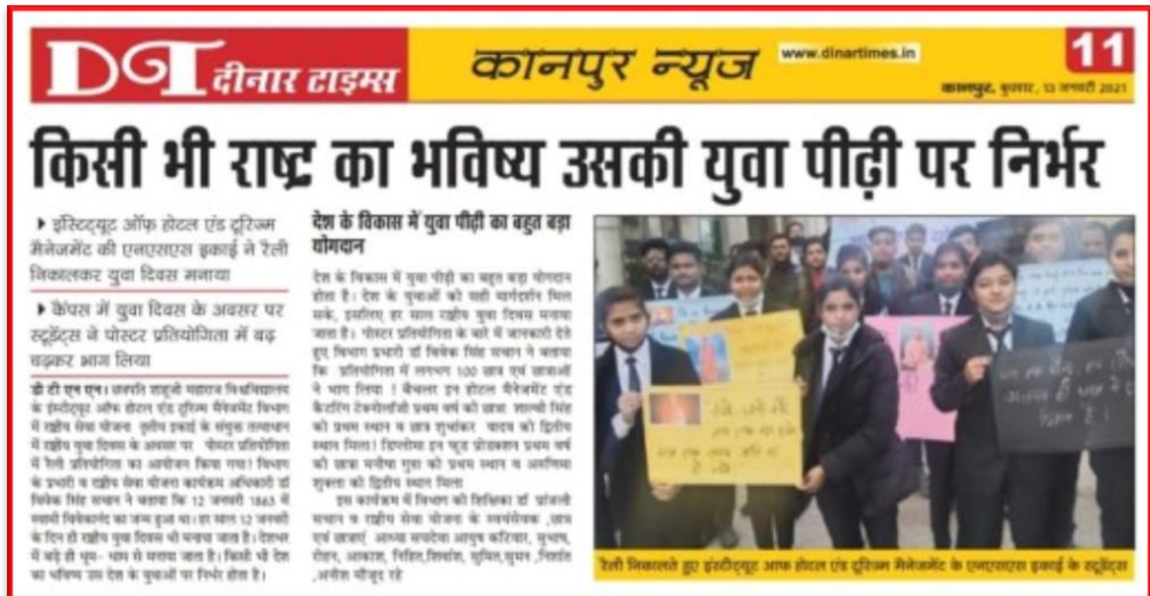
Figure 39 National Youth Day

Organized Rally and Poster Competition on the occasion of National Youth Day.