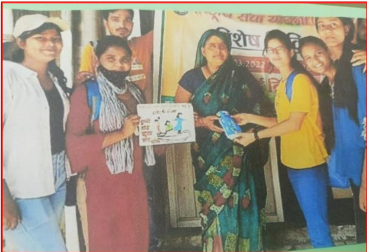
Figure 12 Health and Hygiene

Details of the Program: शिक्षा विभाग के विद्यार्थियों एवं एन०एस०एस० स्वयंसेवक, छत्रपति शाहू जी महाराज विश्वविद्यालय, कानपुर द्वारा दिनांक 29 मार्च 2022 को "स्वास्थ्य एवं स्वच्छता" गतिविधियों का आयोजन किया गया। इस अंतर्गत स्वच्छता से सम्बन्धित बालिकाओं को सैनिटरी पैड वितरित किये गये और उसके उपयोग को समझाया गया।