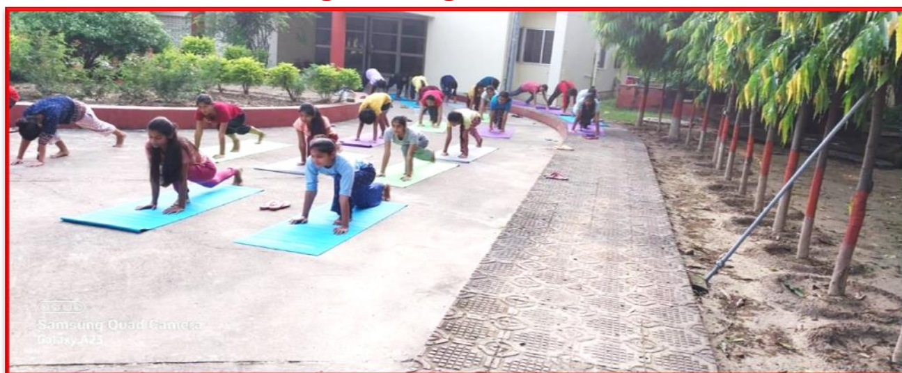
Figure 29 Yoga Awareness