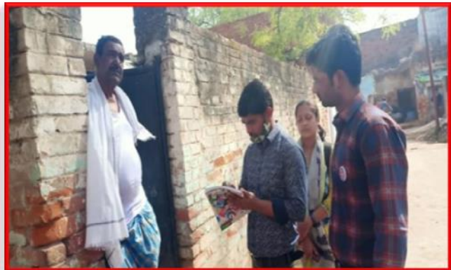
Figure 15 Door to Door Regarding Govt. Scheme