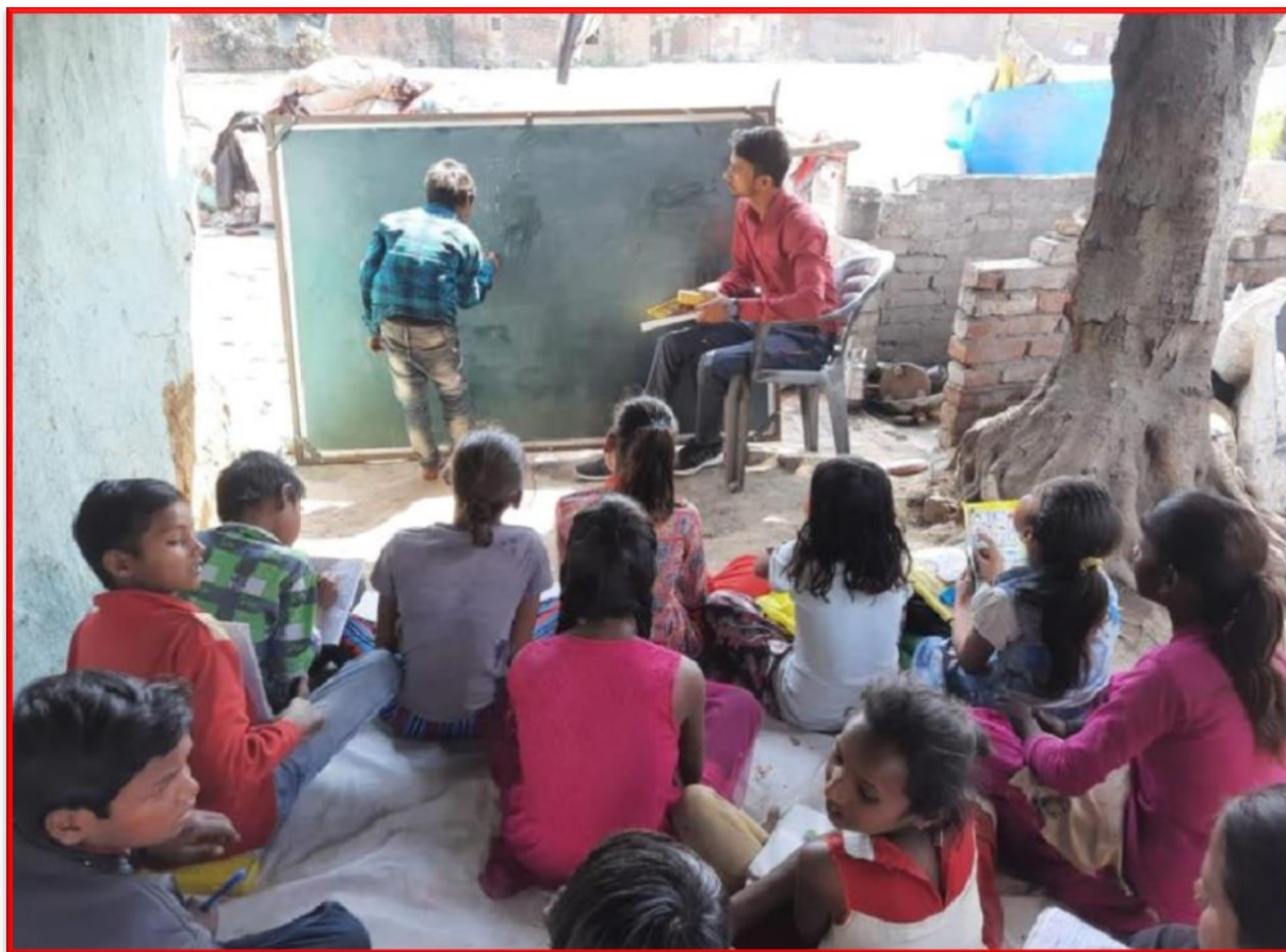
Figure 22 Working with migrated labors' children

Details of the Program: The Department of Social Work's student has taken an initiative to literate the children of migrated parents. He was taking the class nearby the constructed site where their parents were working and with the support of community he got a place and make it open class under the sky. He taught more than 40 students during this initiative.