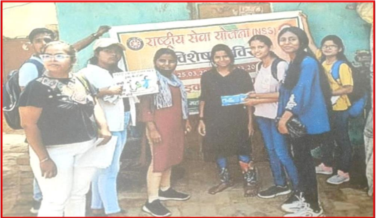
Figure 13 Health and Hygiene