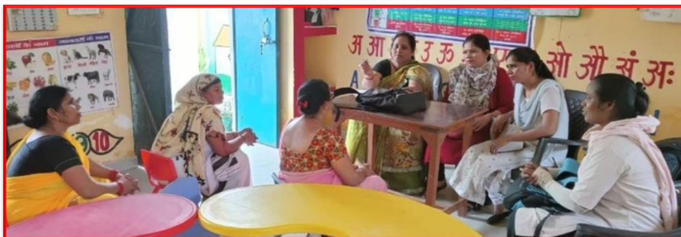
Figure 21 Working with Anganwadis